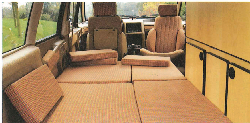
Banquette lit en position couchage.