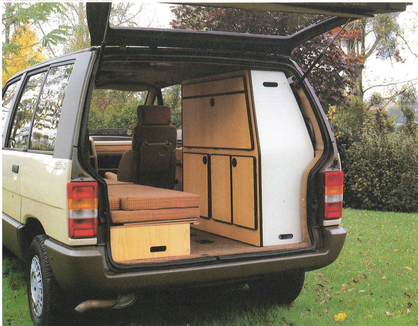
Vue d'ensemble du « mobilier amovible »